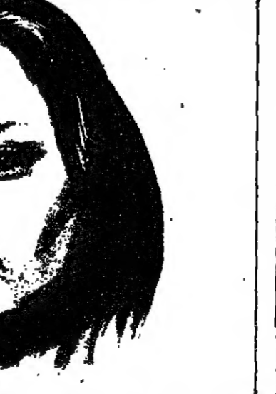
كيم بنت الحرام ضحية من ؟

وكل من عرف ثريا يعرف لها بالجاذبية التي يصعب بل ويستحيل على البعض مقاومتها . فثريا كما وصفتها احد الصحفيين « امرأة مثالية في المثل . . . اي رجل في متناول يدها » . لكن خطورة ثريا هي في مكانتها ومكرها مما يجعل جاذبيتها الجنسية سلاحا حديرا .